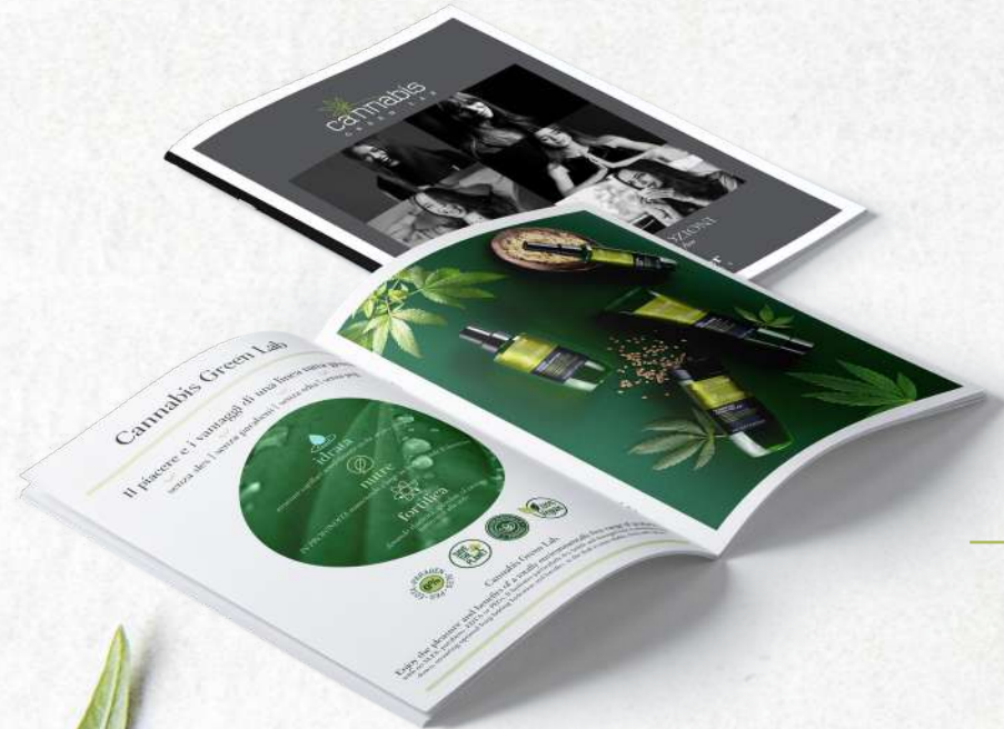
LEAFLET IT_EN cm 15x21 cod. PROM0000625