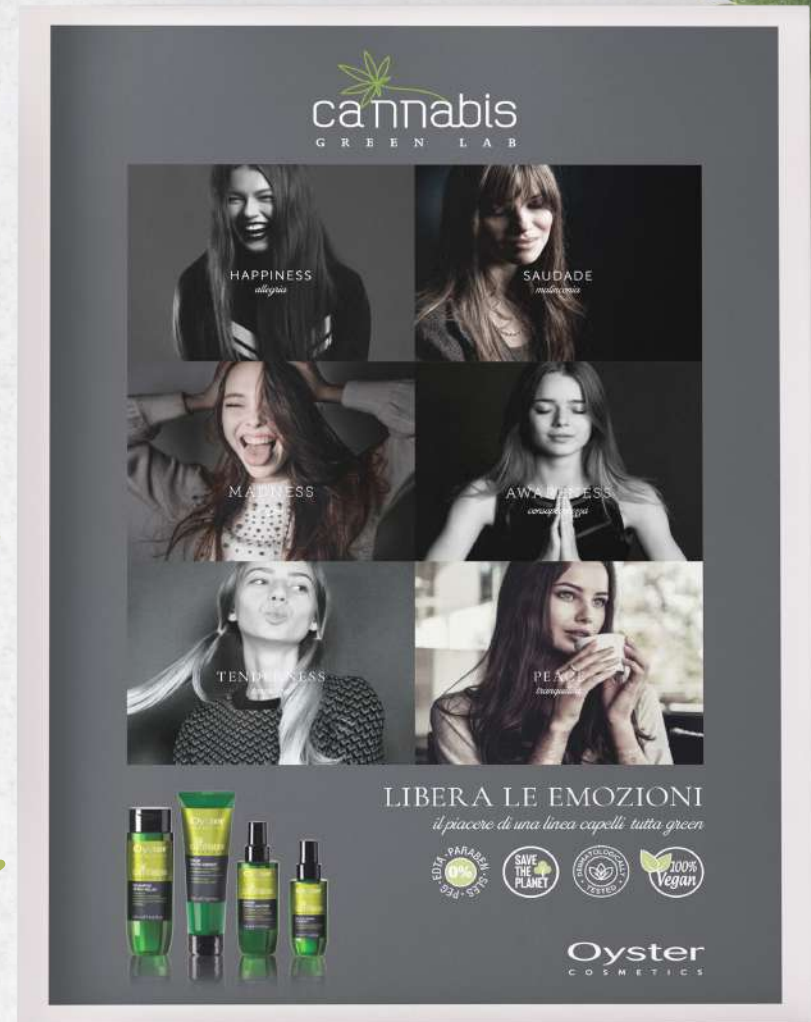
POSTER IT_EN cm 70x100 cod. PROM0000266