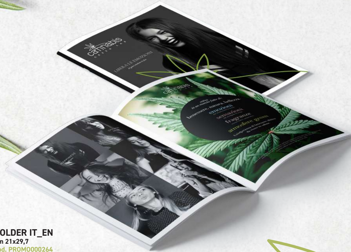
FOLDER IT_EN cm 21x29,7 cod. PROM0000264